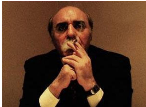
il mercante d'armi Manuchehr Ghorbanifar

Questo secondo estratto è preso dal capitolo 1 del rapporto Walsh su Irangate: